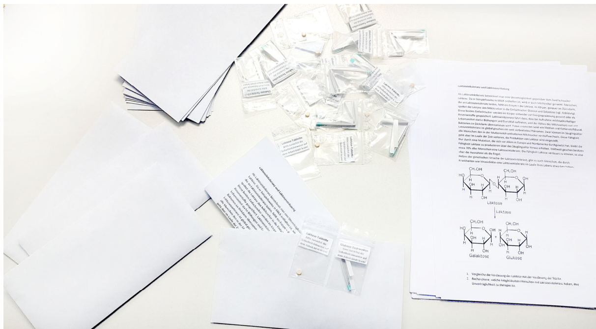
Abbildung 2: Vorbereitete Briefe zum Versand von Laktase-Tabletten und Glukose-Teststreifen

Laktase-Tabletten sind in jeder Drogerie und in größeren Supermärkten erhältlich – meistens in Form von Spenderdosen (vgl. Abb. 3). Glukose-Teststreifen sind zum Beispiel in Apotheken erhältlich, entweder auf Papierbasis oder als Kunststoffstreifen. Zu beachten ist hierbei, dass keine Streifen gekauft werden, die für elektrische Diabetis- bzw. Blutzucker-Messgeräte gedacht sind, sondern solche für manuelle Urin-Analyse. Weiter sollten es solche sein, die nur aus Glukose reagieren und nicht auch noch auf andere Parameter wie etwa Nitritgehalt, Proteingehalt oder pH-Wert. Beide Produkte sind einerseits auch im Versandhandel erhältlich und andererseits nicht apothekenpflichtig, sodass es also keine Versandapotheke sein muss. Hier kann – je nach räumlicher Situation und Wohnort – unterschiedlich vorgegangen werden. Schüler*innen in der Nachbarschaft können direkt erreicht werden, wodurch auch ein kurzer sozialer Kontakt ermöglicht wäre. Bei Schüler*innen, die in größerer Entfernung wohnen, wird wohl der Postweg notwendig sein. Hier kommt es auch darauf an, Enzym- und Nachweismaterial sachgerecht zu verpacken. Es bieten sich kleine Beutel mit „Zip“- oder Klick-Verschluss an. Mit oder ohne Arbeitsblätter verpackt, sollten die Materialien in einem Briefumschlag sicher bei den Schüler*innen ankommen.