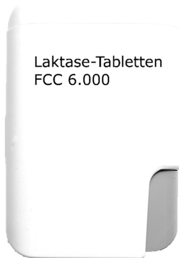
Abbildung 3: Typische Spenderdose für Laktase-Tabletten